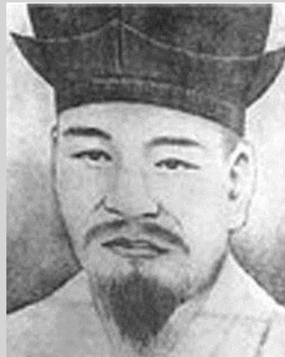
Со Ген Док Корей оқымыстысы, философ